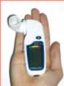
KOKO-PEAK-PRO (medidor función pulmonar)