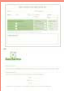
Hoja de recogida de datos

Análisis estadístico de los datos recogidos durante una campaña de detección precoz de la EPOC.